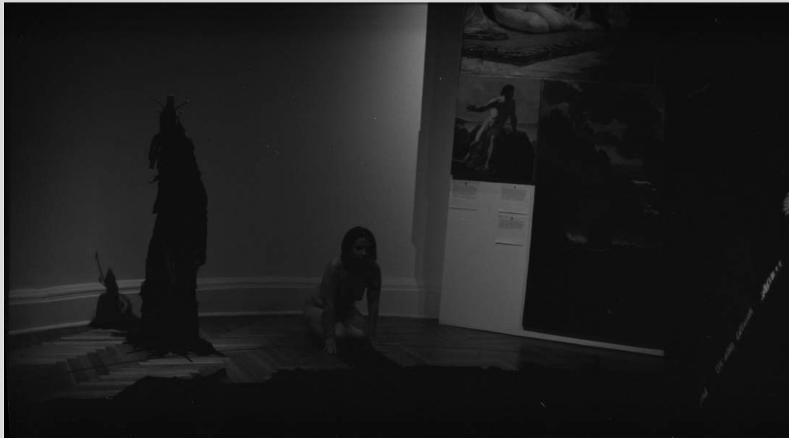
El negro oscuro del cielo. Performance. Museo Nacional de Bellas Artes, 2024.

He cortado un pedazo de mi alma, despacio y a conciencia. He recortado silenciosamente una parte de mi vida y de apoco me he ido vaciando hacia dentro. He visto morir vidas y creo que así uno se va rompiendo en partes que van quedando a lo largo del tiempo dentro de otras cosas.