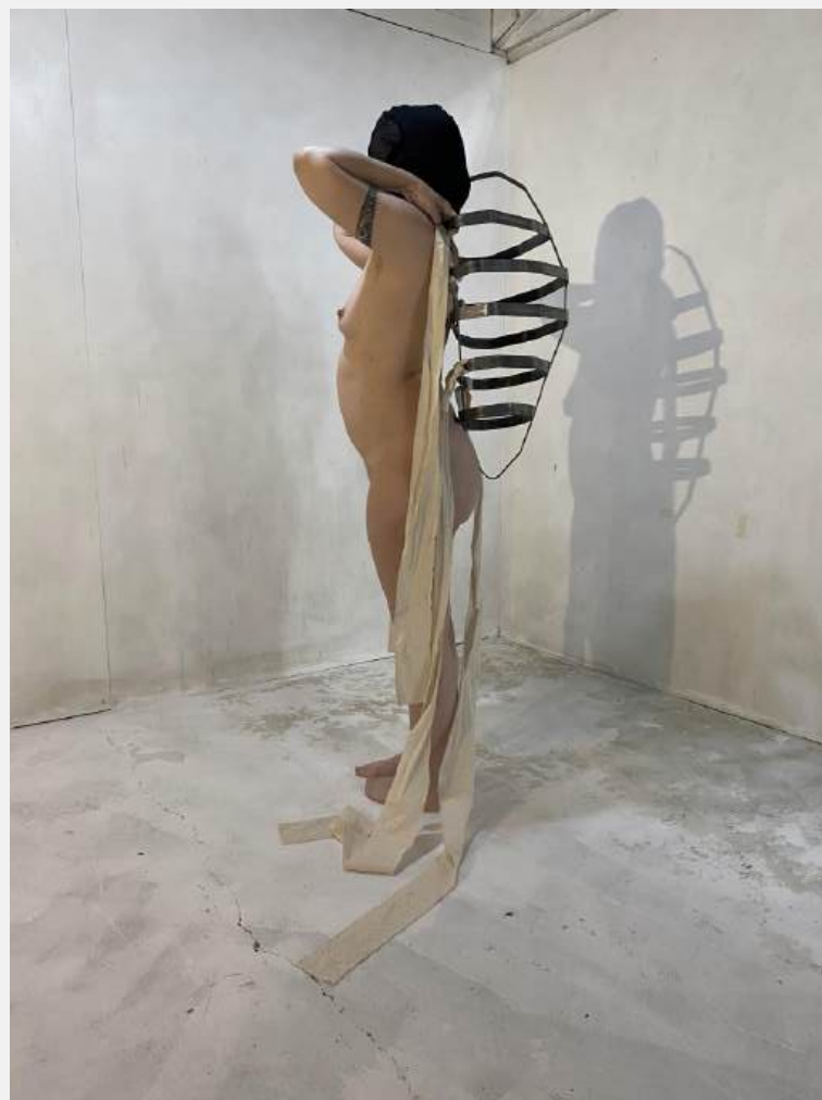
Cuando los pájaros caen. Instalación. Proyecto Fijar la mirada. Taller de obra. MAV. Galería D21., 2024