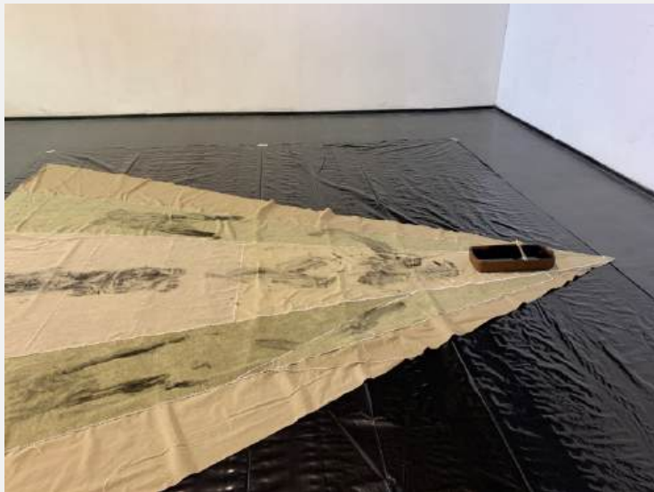
La desigualdad del tiempo. Registros videoperformance. 2023