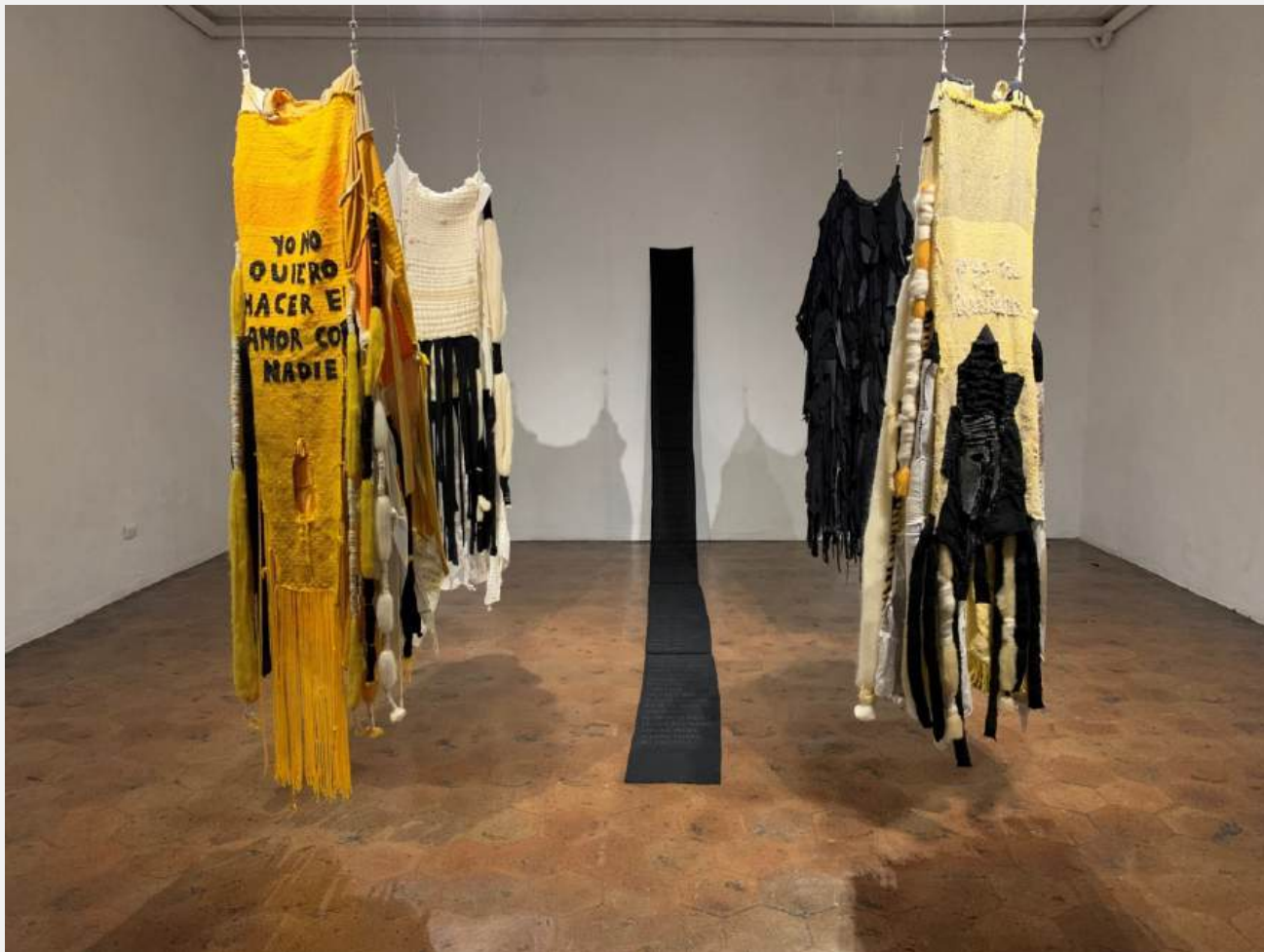
Instalación. Piezas textiles, tejido telar, costura manual de retazos de tela y ropa donada de mujer, pintura sobre tela, embarrilados, bordado.