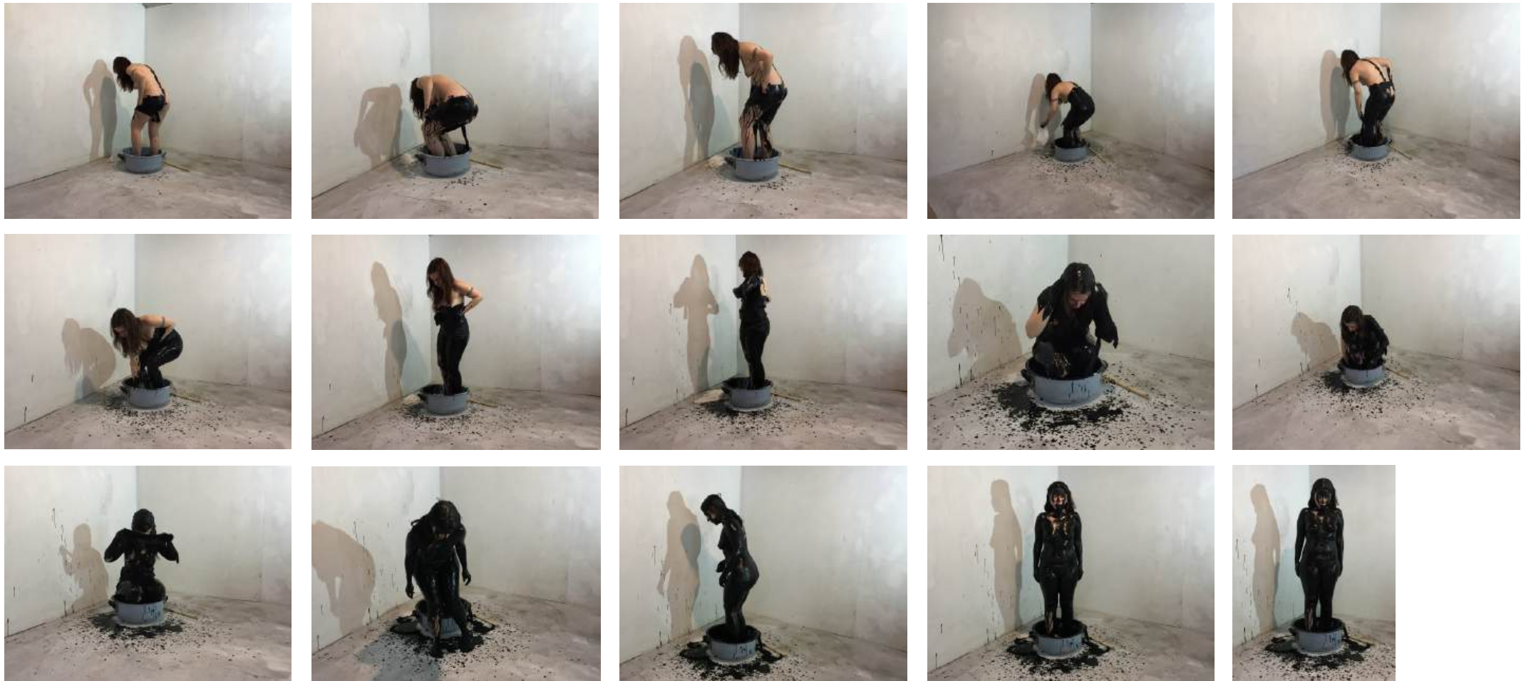
Secuencia fotográfica, videoperformance El alma de los pájaros . (2021)