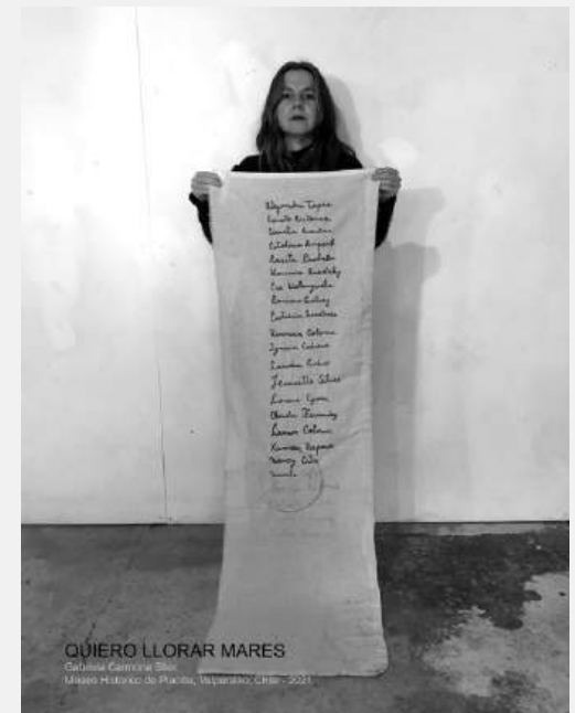
Tela bordada con los nombres de cada mujer que donó vestuarios para la instalación.