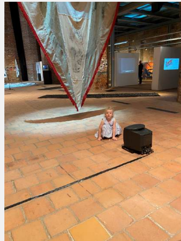
La desigualdad del tiempo. Instalación. Nomade Bienal, Bestian en llamas. Centrum Sztuki Galería EL. Elblag, Polonia. 2023