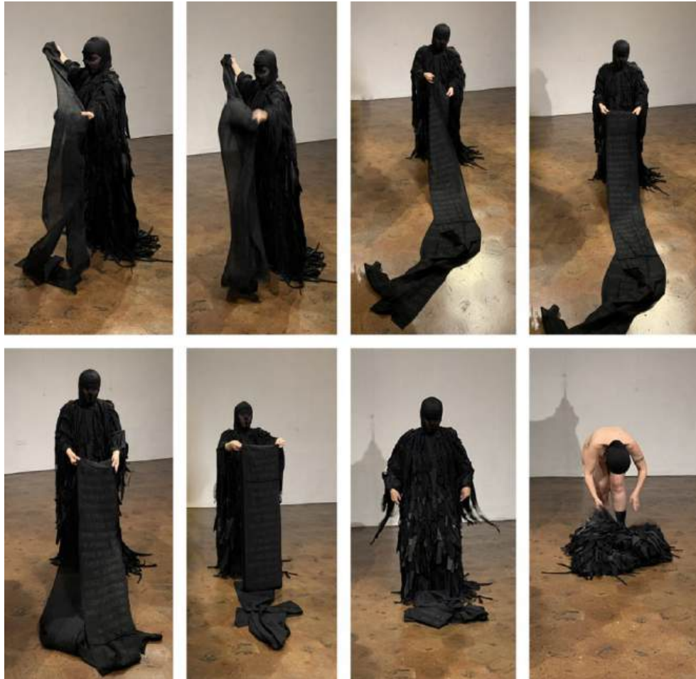
Fotoperformance. Museo Municipal y de Arte Moderno, MMAM, Cuenca, Ecuador, 2022