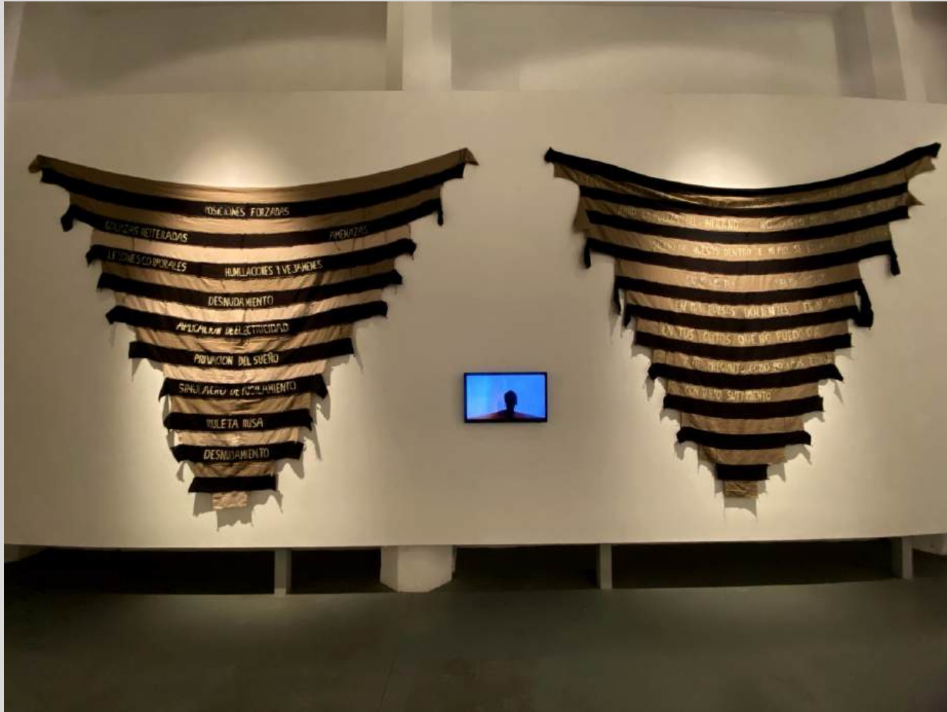
La desigualdad del tiempo. Instalación. Proyecto Umbra, Museo macro. Rosario, Argentina. 2023