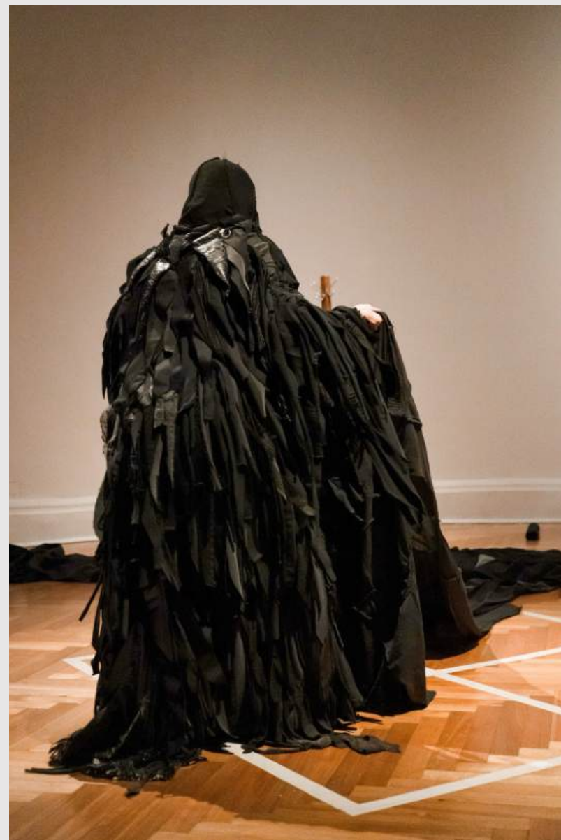
El negro oscuro del cielo. Performance. Museo Nacional de Bellas Artes, Santiago, Chile. 2024